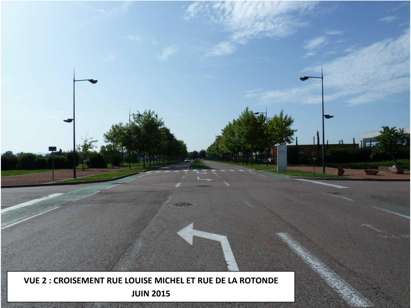
VUE 2 : CROISEMENT RUE LOUISE MICHEL ET RUE DE LA ROTONDE JUN 2015