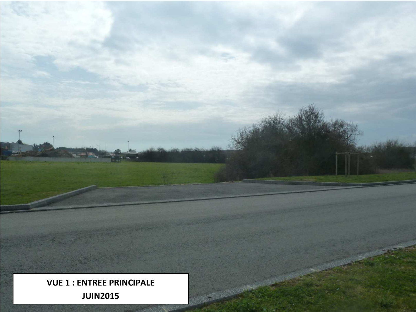
VUE 1 : ENTREE PRINCIPALE JUN2015